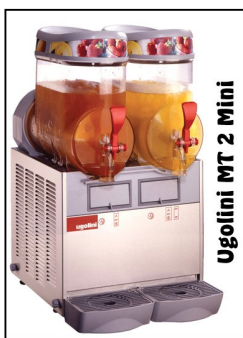
Ugolini MT 2 Mini