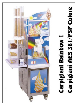
Carpigiani Rainbow 1 Carpigiani AES 381/PSP Colore