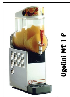
Ugolini MT 1 P