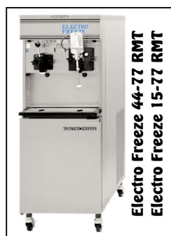
Electro Freeze 44-77 RMT Electro Freeze 15-77 RMT