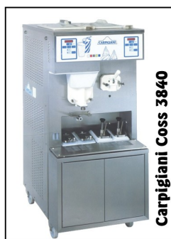
Carpigiani Coss 3840