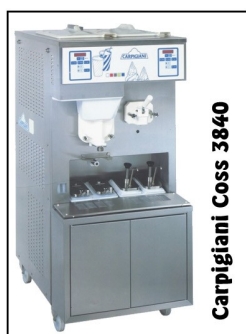
Carpigiani Coss 3840