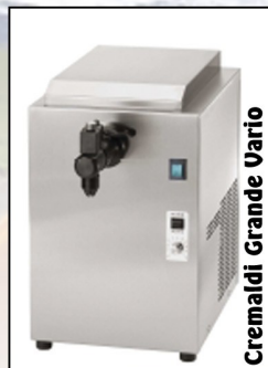
Cremaldi Grande Vario