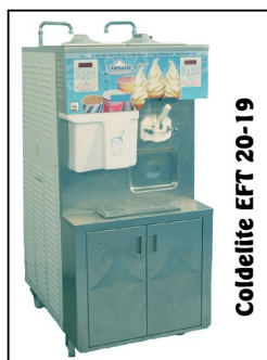
Coldelite EFT 20-19