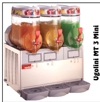
Ugolini MT 3 Mini