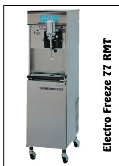
Electro Freeze 77 RMT