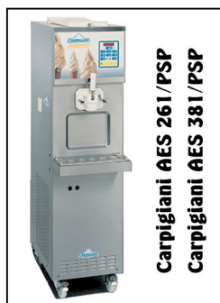
Carpigiani AES 261/PSP Carpigiani AES 381/PSP