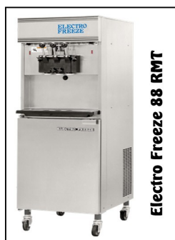
Electro Freeze 88 RMT