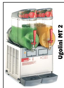
Ugolini MT 2