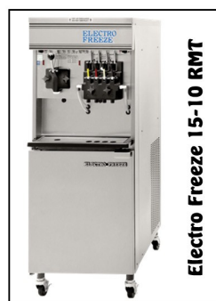
Electro Freeze 15-10 RMT

Lody świderki systematycznie zdobywają rynek lodowy w Polsce. Najbardziej popularną marką maszyn używaną do produkcji świderków jest amerykański Electro Freeze . Być może dlatego świderki często nazywane są lodami amerykańskimi.