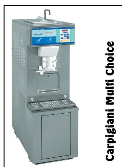
Carpigiani Multi Choice