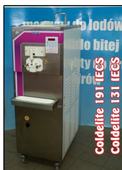
Coldelite 191 IECS Coldelite 131 IECS