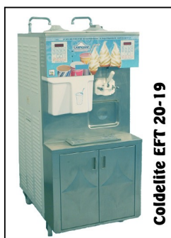
Coldelite EFT 20-19