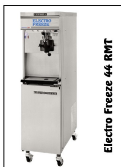
Electro Freeze 44 RMT