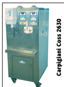
Carpigiani Coss 2630

Lodel ul.F.Ceynowy 12 84-120 Władysławowo