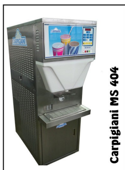
Carpigiani MS 404