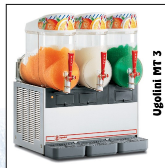
Ugolini MT 3