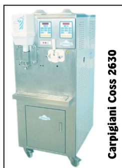
Carpigiani Coss 2630