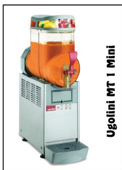
Ugolini MT 1 Mini

www.lodel.pl www.sanommat.pl www.ugolini.pl