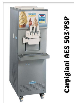
Carpigiani AES 503/PSP

Maszyna do lodów to podstawowe urządzenie w Twojej lodziarni. Optymalny wybór właściwego automatu to klucz do sukcesu. Aktualnie posiadamy "od ręki" przebogaty asortyment maszyn - nowych i używanych. Koniecznie sprawdź!