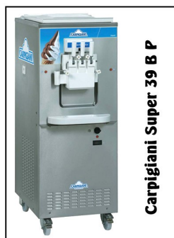
Carpigiani Super 39 B P