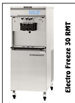
Electro Freeze 30 RMT

Lodel ul.F.Ceynowy 12 84-120 Władysławowo