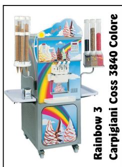
Rainbow 3 Carpigiani Coss 3840 Colore