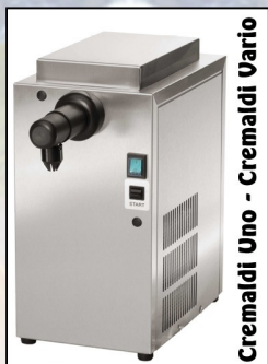
Cremaldi Uno - Cremaldi Vario